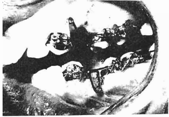
Resim 1. Araştırmada Kullanılan .016 x.016 inç Alt Bölümlü Arklar.

rına 5-7 derecelik açı ile) puntalanmıştır (Resim 1). Dört vakada alt 2. molarlar da bantlanmıştır. Alt 1. premolar çekiminden sonra alt çeneye 0.40 x 0.40 mm (0.016 x 0.016 inç) kare kesitli telden, kaninlerin distalinde ters kapatma zembereği (reverse closing loop), ikinci premolar braketinin hemen distalinde bağlama bükümü (tie-back) bulunan; birinci, ikinci ve üçüncü düzen bükümleri Ülgen (13)'in belirttiği şekilde bükülmüş olan bölümlü arklar (sectional arches) bağlanmış ve ilk üç hafta için aktive edilmemişlerdir. Sonraki üçer haftada bir yapılan kontrollarda 100-150 gr. kuvvet uygulanacak şekilde aktivasyonlar yapılmıştır.