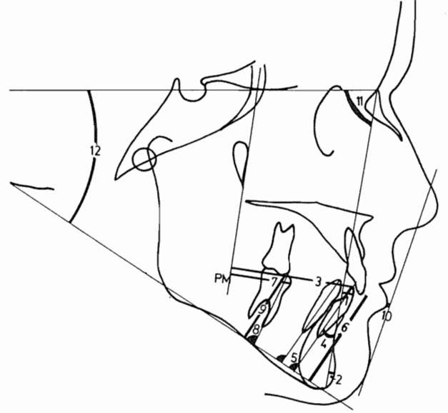
Şekil 2. Araştırmada Kullanılan Açısal ve Boyutsal Ölçümler (1. Alt 1-NB, 2. Pg - NB, 3. Alt 1 - PM, 4. Alt 1 / NB, 5. Alt 1 / Go - Gn, 6. Alt 1 - Go - Gn, 7. Alt 6 - PM, 8. Alt 6 / Go - Gn, 9. Alt 6 - Go - Gn, 10. S. çizgisi-Alt dudak, 11. SNB, 12. S-N/Go-Gn).

Tedavi başı ve bölümlü ark çalışma süresi sonu ortalamalar arası farkın biyometrik önem kontrolü eşleştirilmiş t testiyle yapılmıştır.